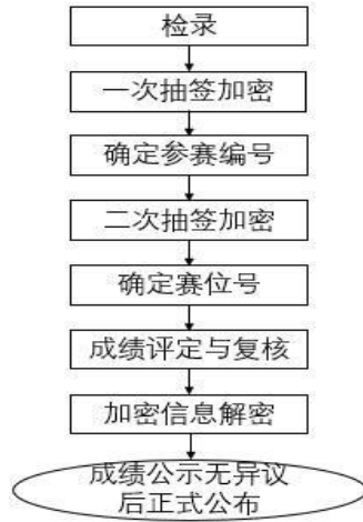
图 2 成绩管理流程图